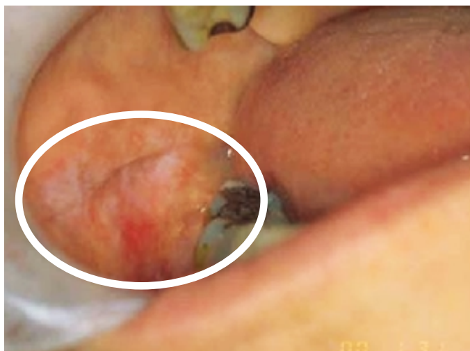
Lokal slimhinnereaksjon mot en amalgamfylling. Den kliniske diagnosen var lichenoid kontaktreaksjon.

Allergier overfor tannrestaureringsmaterialer kan vise seg som en lokal kontaktreaksjon. Det er en likhet mellom dette og lichen planus både utseendemessig og mikroskopisk. Dersom en i slike tilfeller fjerner allergenet (tannfyllingsmaterialet), vil sårene/reaksjonene som regel tilhele. Pasienter som har slike kontaktreaksjoner kan søke om trygdestøtte for utskifting av de aktuelle fyllingene.