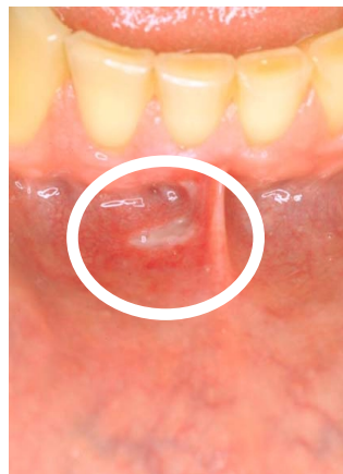
Afte på innsiden av leppen.

Tilstanden er i noen tilfeller forbundet med kroniske sykdommer som Crohns sykdom, cøliaki, ulcerøs kolitt og mangel på jern, vitamin B12 og folsyre.