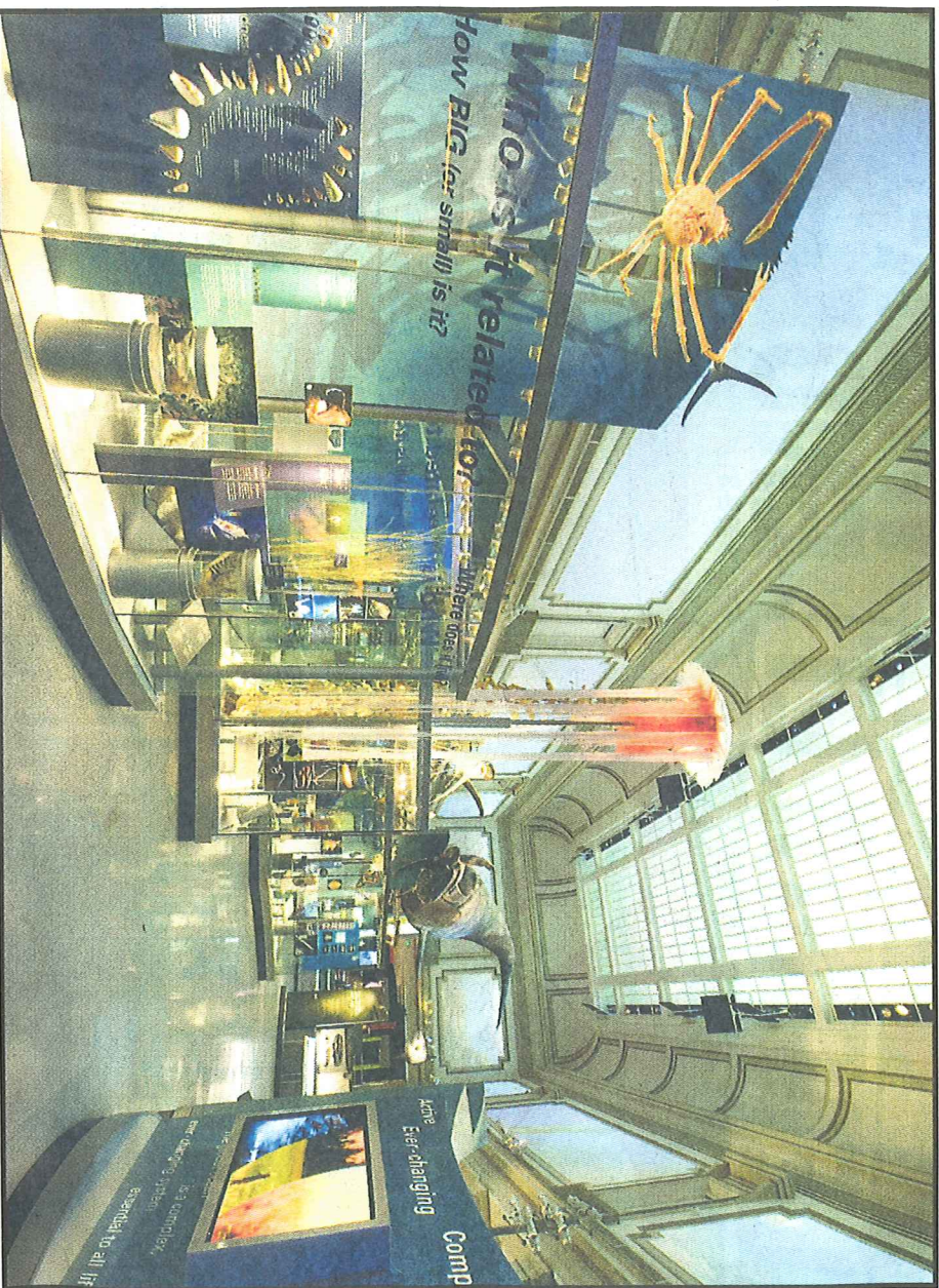
VERDENSBERØMT: Ocean Hall i Smithsonian's National Museum of Natural History i Washington DC hvor utstillingen «Dypere enn lyset» er på plass.

Telefon: 55 23 51 61 Mobil: 482 98 148 godmorgen@ba.no