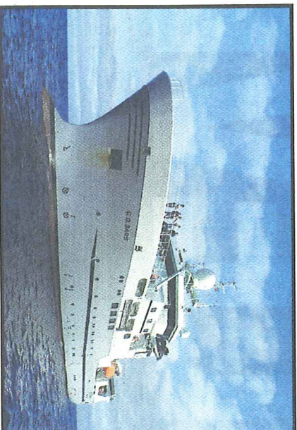
VIKTIG: Forskningskipet «G.O. Sars».