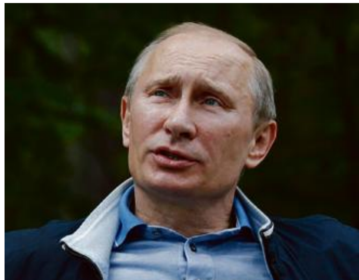
Kor mykje toler Vladimir Putin i ein russisk roman?