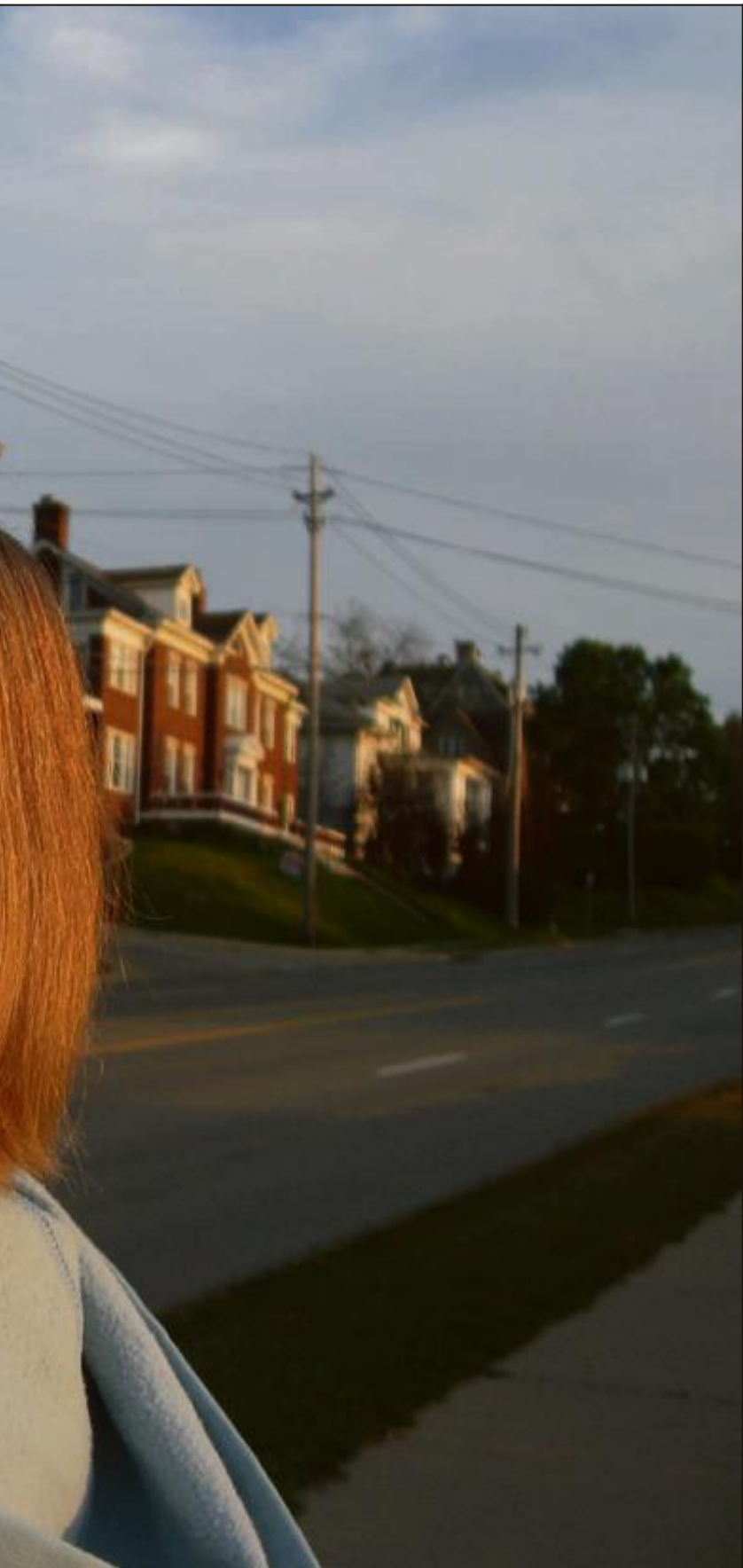
han mellom to permar, men då var mykje endra.

i Russland». Utdrag frå romanen hans En Opritsjniks dag , som kan lesast som ein satire over Putin-Russland, vart rett nok publisert i den regjeringstrugne avisa Izvestija . Kanskje er det eit teikn på den marginaliserte stillinga som skjønnlitteraturen likevel har i Russland i dag