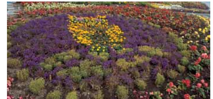
La chouette de l'Université au Champs en soleillé

Ici on a réuni quelques plantes à usage spécial comme le lin, les bulbes et les pommes, l'angélique de Voss qui est peut être le légume norvégien le plus ancien. Le jardin présente aussi au visiteur une collection de 45 sortes différentes de pommes de terre.