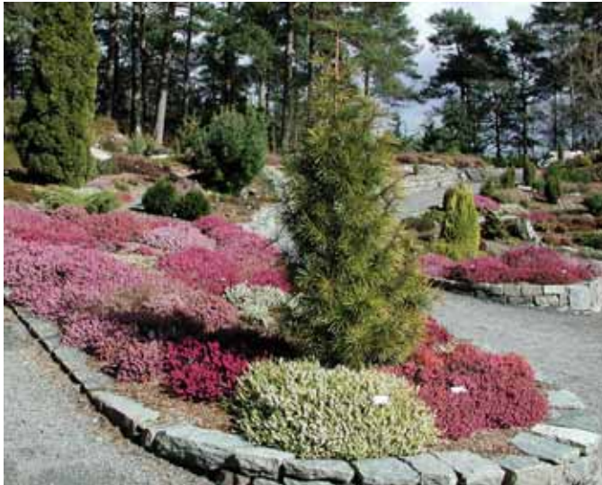
Variations au jardin des bruyères

Les plantes cultivées ici viennent souvent de régions tempérées. Le but du Jardin Botanique et de l'Arboretum est de rassembler la plus grande variation possible de plantes sauvages et de plantes cultivées que les hommes ont développées pour leur usage, spécialement celles originaires de la région ouest du pays (Vestlandet). De cette manière l'Arboretum et le Jardin Botanique jouent un rôle important pour la sauvegarde et l'utilisation des ressources génétiques dans les domaines de l'horticulture, de l'agriculture, de la sylviculture et de la préservation du paysage