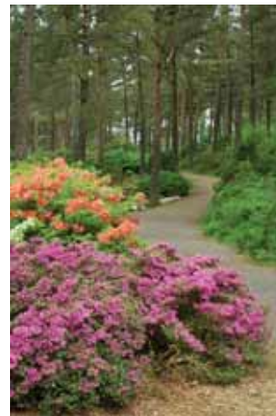
Rhododendrons dans la forêt

Des arbres et buissons européens sont exposés le long de la route de Dalsmyra à Mørkevatnet, et des plantes de l'hémisphère Sud à partir de Lynghaugen vers le sud, sur les collines dans la direction de Nydalen. La collection des plantes originaires d'Asie est plantée depuis Miniarboretet (43, 45) vers le nord jusqu'à Gjørvikhaugen et Nore Krossdalene alors que les espèces d'Amérique se trouvent d'Oldertøset jusqu'à Mørkevågen.