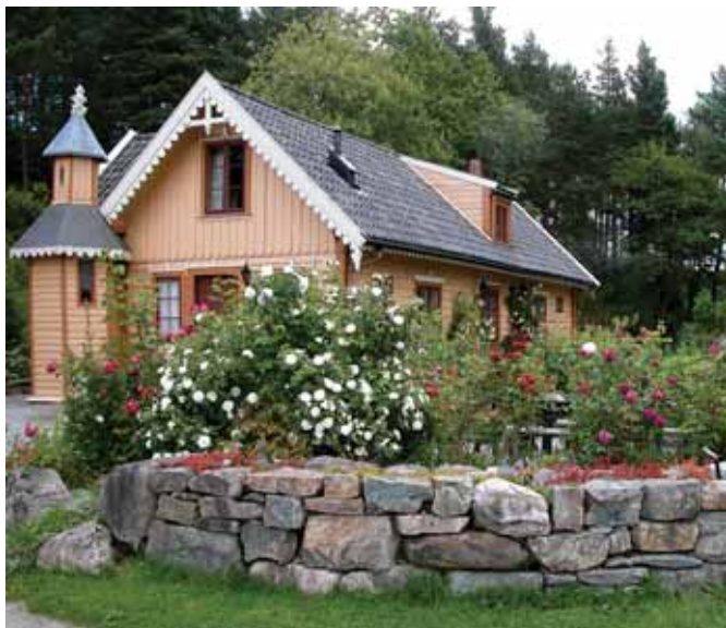
Un été dans le jardin près de «La maison aux dentelles»

«La maison aux dentelles» fut construite avant 1850 et se trouvait alors à Bergen là où aujourd'hui se trouve le centre hospitalier. Lorsque celui-ci fut agrandi en 1973, la maison fut démontée et reconstruite à Milde en 1992. Aujourd'hui, elle est utilisée comme café et lieu de réunion pour les visiteurs, comme salle de classe pour l'enseignement, etc. Dans le jardin sont exposées des plantes historiques traditionnelles.