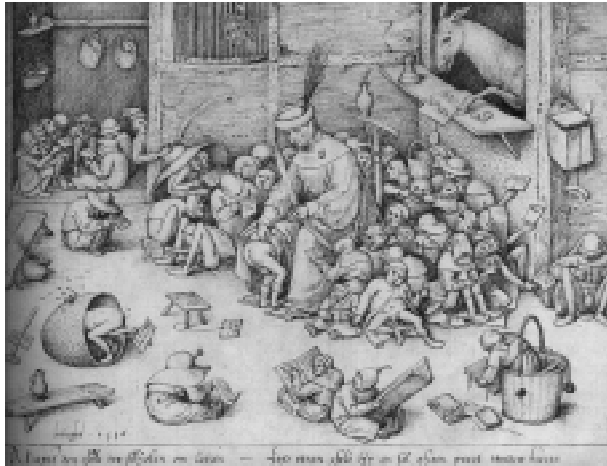
Pieter Bruegel d.e., The Ass in the School, 1556