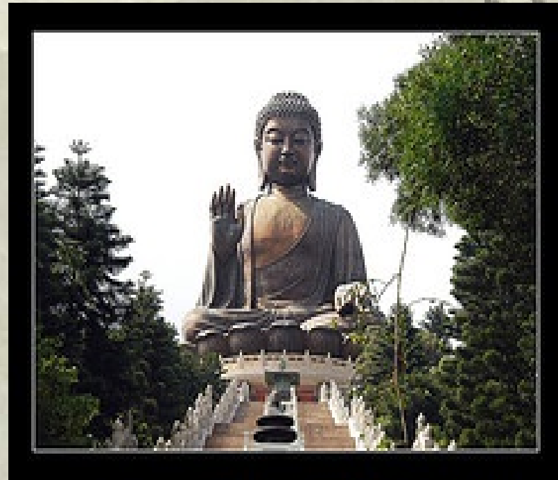
Tian Tan, Hong Kong