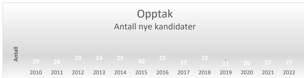
Figur 1, Opptak av nye ph.d.-kandidater, 2010 til 2022

I 2022 tok fakultetet opp 27 nye ph.d.-kandidater, likt som året før.