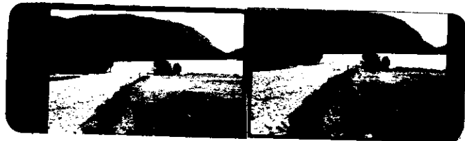
Oversiktsbilde tatt fra veien, mot ØNO Stokken midt på bildet markerer funnsted 1