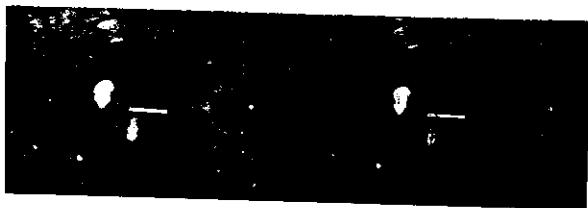
Nærbilde av funnsted 3 mot ØNO (jernfragmenter + stykke bronseblekk)