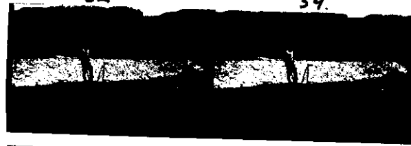
Funnsted 1 markert med trestokk til høyre for personen på bildet Tatt mot vest