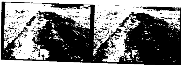
Det utgravede feltet tatt mot ØNO. Mulig grav i forgrunnen. Steinen som markerer funnsted 1 er fjernet.