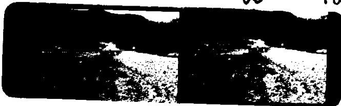
Oversiktsbilde tatt mot VSV Personen midt på bildet markerer funnsted 1