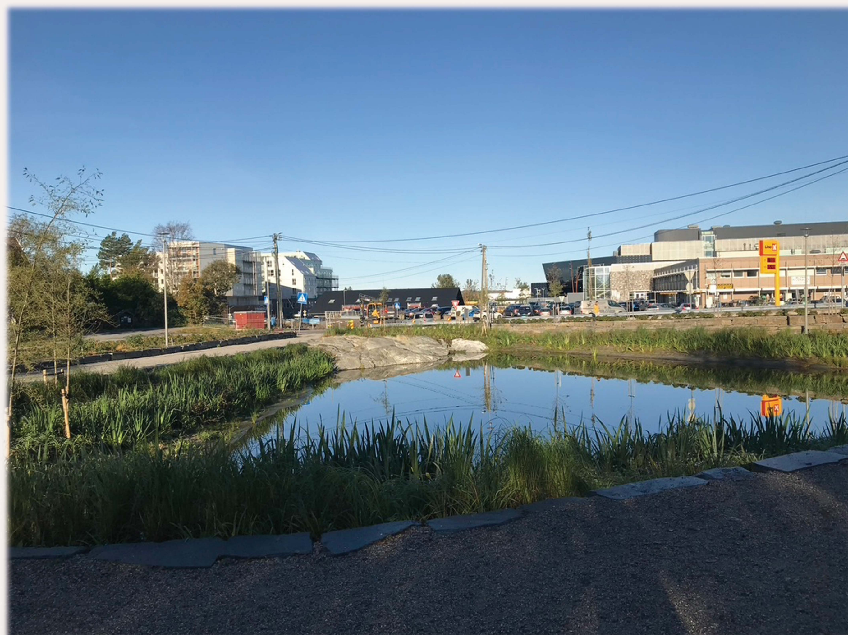
Privat bilde: Bildet viser den blå-grønne infrastrukturen som er etablert

I dette prosjektet gjennomføres det semi-strukturerte intervjuer, observasjon av området og dokumentanalyser. Intervjuene er gjort med private aktører og kommunale planleggere. Det er også planlagt å intervju inbyggere og velforeninger.