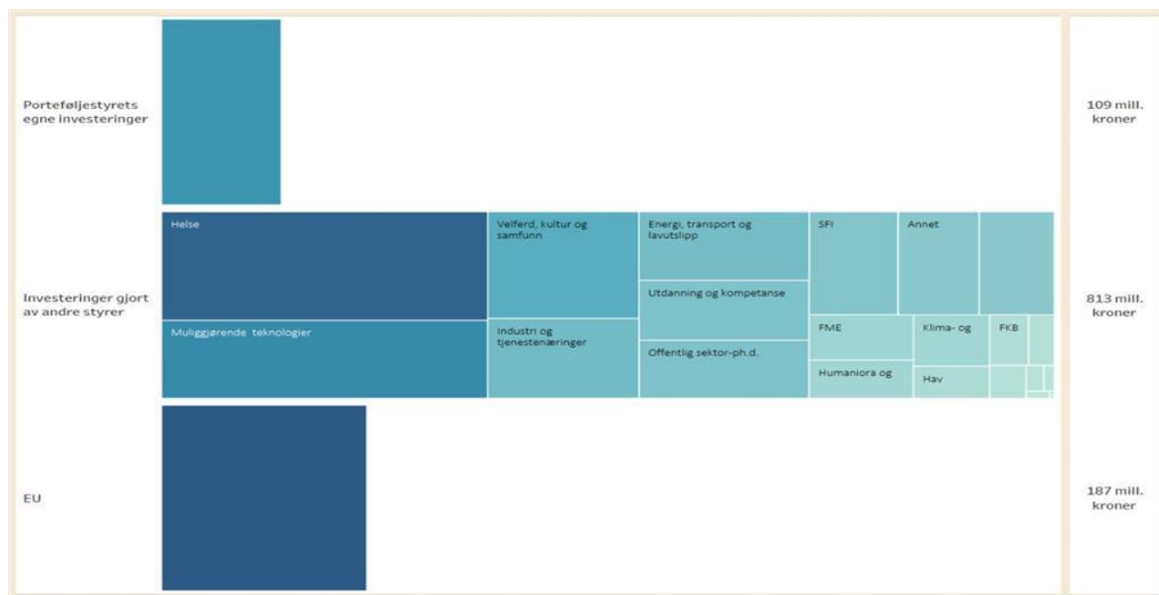
Figur 4. De relative bidrag til den totale porteføljen for Demokrat for året 2020.

Det er viktig å utvikle samarbeid med porteføljestyre som har tilgrensende ansvarsområder og tematikk.