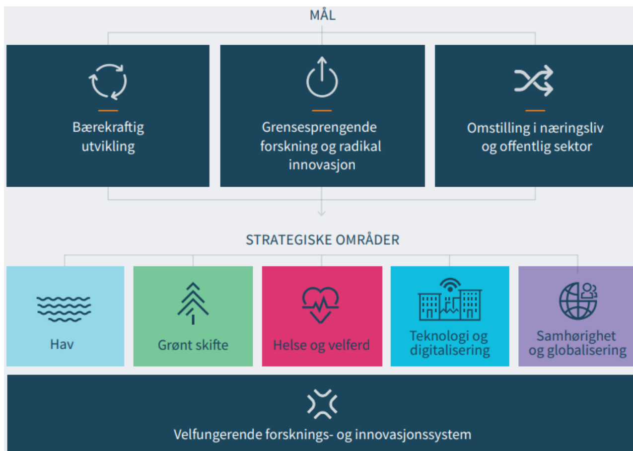
Figur 2. Målbildet i Forskningsrådets strategi 2020-2024.

Porteføljeplanen er forankret i Langtidsplan for forskning og høyere utdanning. I tillegg er flere stortingsmeldinger relevante for denne porteføljen. Vi vil særlig trekke frem Meld. St. 14 (2020-2021) Perspektivmeldingen 2021 , Meld. St. 30 (2019-2020) En innovativ offentlig sektor og Meld. St. 5 (2020-2021) Samfunnssikkerhet i en usikker verden .