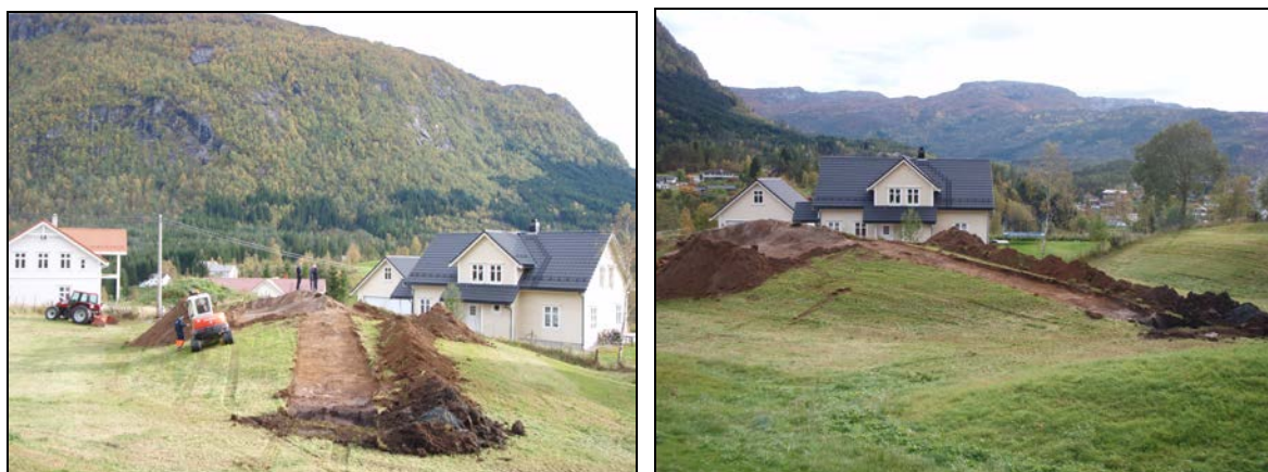
Fig. 5. En sjakt mot vest fra haugen ble gravd for å finne eventuelle forhistoriske strukturer.

Fragmenter av glass og porselen/steingods i haugmassen vitner om ytterligere forstyrrelser av haugen. Det ble i tillegg gravd en sjakt mot nordvest for å se etter eventuelle strukturer (kokegroper, ildsteder etc.) i forbindelse med mulige rituelle aktiviteter i forbindelse med haugen (jf. fig. 5). Heller ikke her ble funnet spor av forhistorisk aktivitet.