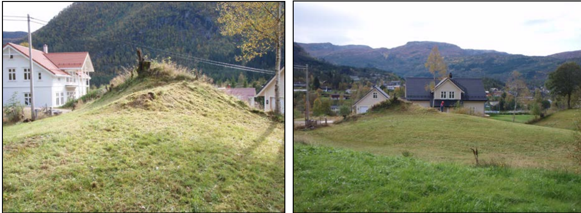
Fig. 2. Hagens nordre del før sikringsgravning, sett mot øst.