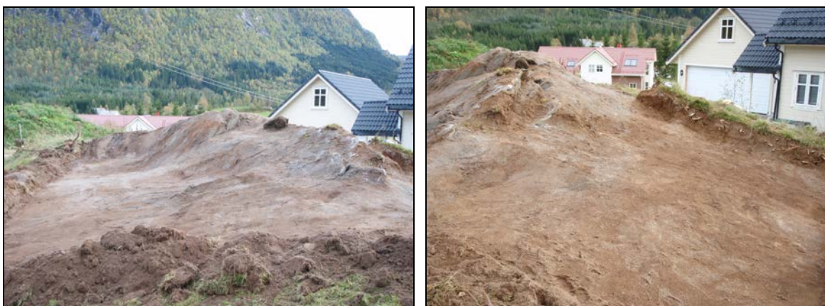
Fig. 4. Jorddekket på bergknausen ble fjernet ved sikringsgravningen.

På denne måten ble all det meste jorddekningen på haugen fjernet (jf. fig. 4). Berget under var til dels svært forvitret og var blandet med jordmassen over. Sprekker i berget ble spesielt undersøkt nærmere med tanke på mulige nedgravninger. Ved undersøkningen ble det ikke funnet spor etter forhistorisk aktivitet verken i haugmassen eller i bergsprekkene.