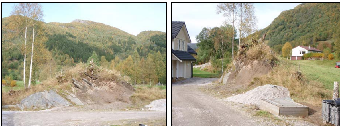
Fig. 3. Hagens søndre del før sikringsgravning, sett mot nord (bilde t.v) og mot vest (bilde t.h.).

På denne måten ble all det meste jorddekningen på haugen fjernet (jf. fig. 4). Berget under var til dels svært forvitret og var blandet med jordmassen over. Sprekker i berget ble spesielt undersøkt nærmere med tanke på mulige nedgravninger. Ved undersøkningen ble det ikke funnet spor etter forhistorisk aktivitet verken i haugmassen eller i bergsprekkene.