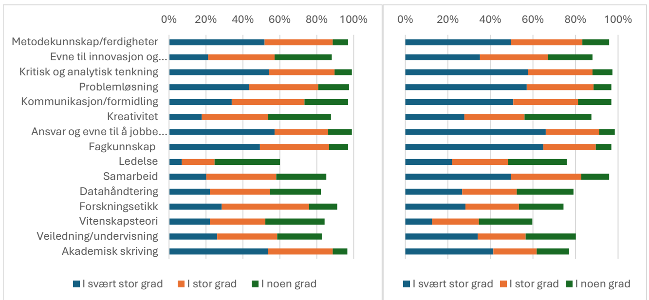
Figur 3: Andel respondenter som har svart i svært stor, i stor og i noen grad at de har oppnådd kunnskaper ferdigheter og kompetanser etter endt ph.d.-utdanning innen ulike kategorier (til venstre) og andelen som svarer at disse kunnskapene, ferdighetene og kompetansene er viktige i nåværende stilling (til høyre).

Når oppnådd kompetanse sammenliknes med kompetanse som er viktig i nåværende stilling (Figur 3, til høyre), er det jevnt over stort samsvar. Samtidig peker undersøkelsen på enkelte forskjeller. Blant annet ledelse og samarbeid vurderes som viktigere i arbeidslivet enn det doktorene opplever å ha oppnådd gjennom ph.d.-utdanningen. Videre er oppnådd kompetanse innen forskningsetikk, vitenskapsteori og akademisk skriving noe høyere enn det nåværende jobber krever.