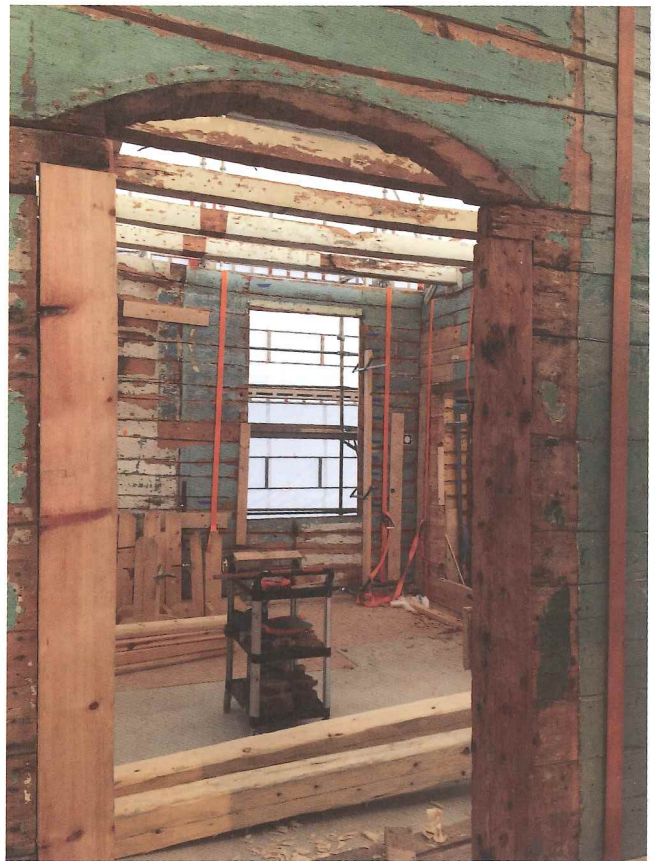
Boga dørøpning med øydelagt beitskier.

Det er eit nytt arbeidslag som vinn konkurransen med gjenreisinga av Lønningen huset, J. H. Nævdal Bygg as og Elin Thorsnes arkitektkontor as, med erfaring frå mellom anna Bryggen-prosjektet. Nye auge ser nye detaljar. Medan grunnarbeidet på går på ettermønter i 2017 er tømrarane i full gang med sitt arbeid i ein lagerhall i Skeielia. Kvar enkelt vegg vert sett saman i liggjande posisjon på ein stor arbeidsbenk. Metoden gjev godt overblikk for naudsynte reparasjonar og enklare arbeidsforhold til å utføra utskifting og reparasjon av stokkar. Metoden gjev og rom for å analysere verktøyspor og byggjeteknikk som var nytta for å reisa huset fyrste