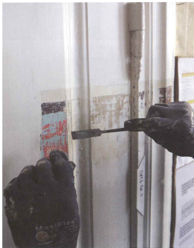
Avdekking av ulike malingslag.