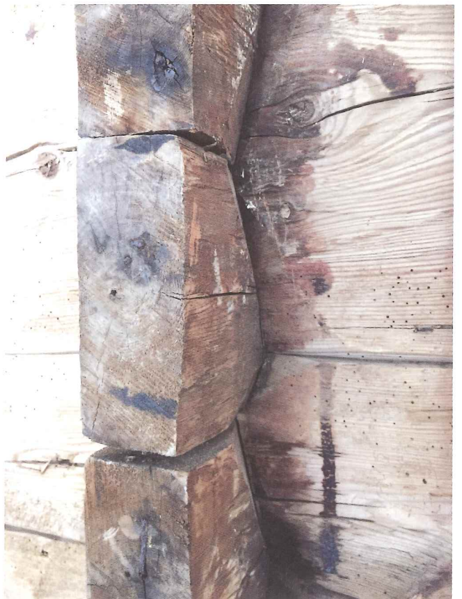
Tjørebreidd nov.