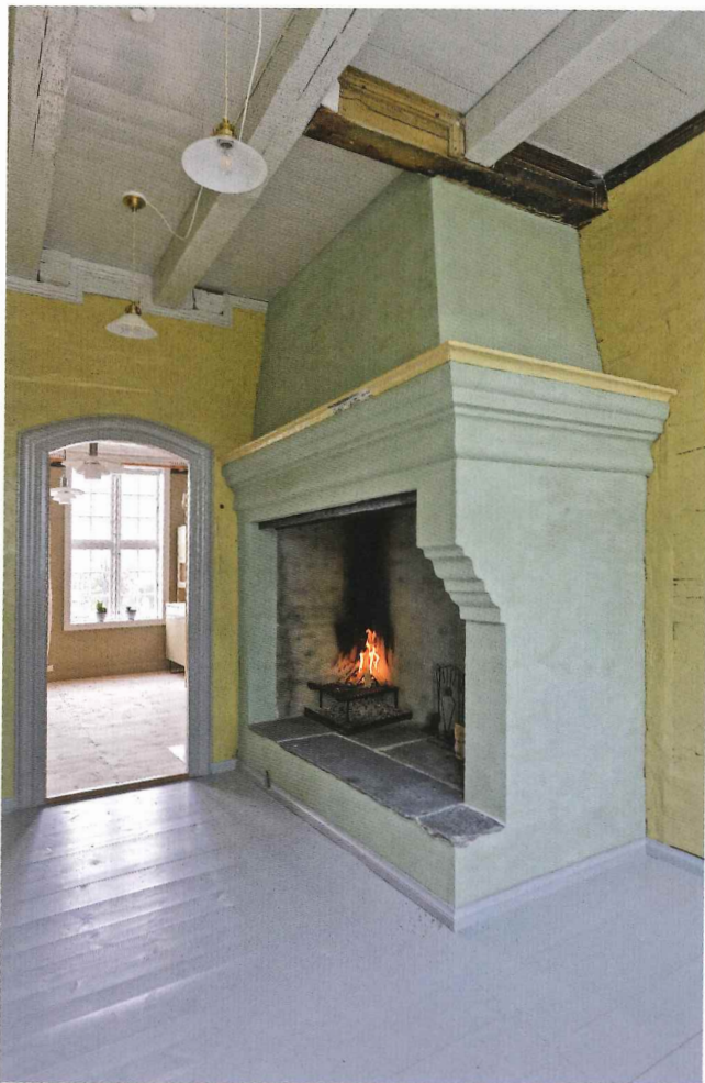
Grua på kjøkenet.