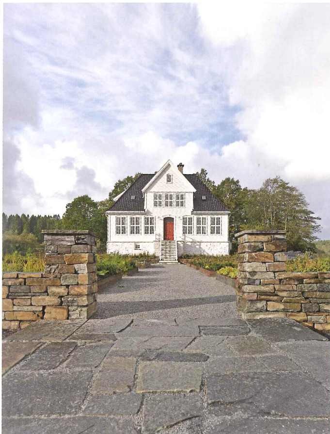
Lønningen Lystgård august 2019