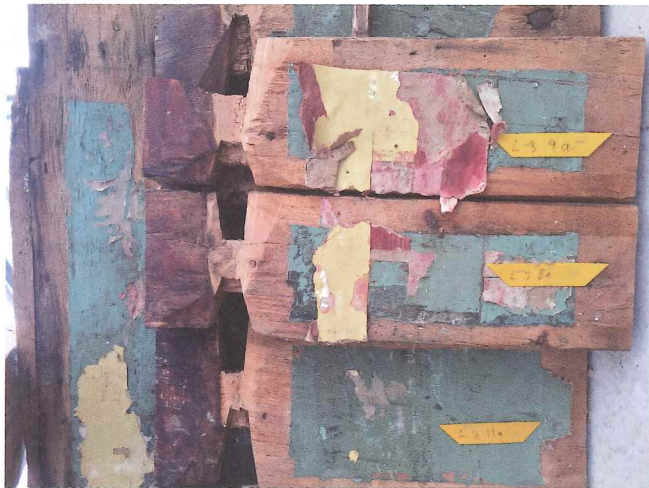
Merka laftestokkar.