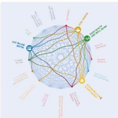
Fig. 1. Illustrating interactions between SDG 2, SDG 3, SDG 7, SDG 14, analyzed by the International Science Council.

Finansiert av Akademia- avtalen: UIB-Equinor