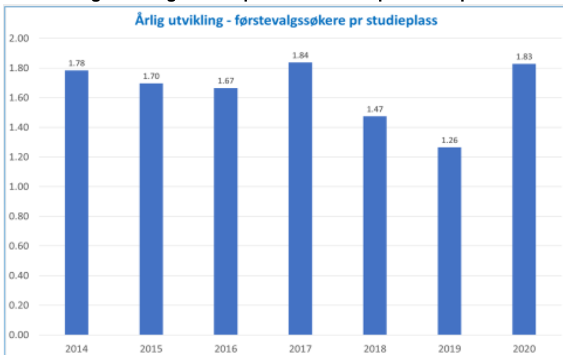
Tabell 3: Årlig utvikling – førsteprioritetssøkere per studieplass:

Selv om vi har flere søkere enn noensinne, har vi også fått flere studieplasser. Det vil si at søkere pr studieplass er 1,83, som er det samme som i 2017. De siste par årene har dette tallet vært svært lavt. Fordelen med et høyt antall søkere pr studieplass, er at det kan gi rom for å få karaktergrenser i flere av studieprogrammene våre.