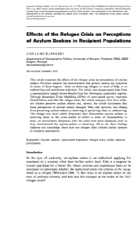
Bjånesøy, L, L (2019) Effects of the Refugee Crisis on Perceptions of Asylum Seekers in Recipient Populations. Publisert i Journal of Refugee Studies.

Artikkelen viser at det var stor villighet blant naboer til å bidra til asylsøkernes hverdag etter at de ankom de tre asylmottakene i studien. Hverdagslige møter som det å ta en kopp kaffe sammen og invitere på middag var viktig for å etablere og opprettholde kontakten mellom nykommere og lokalbefolkningen. Muligheten for slike møter ble imidlertid i stor grad påvirket av måten asylmottak ble drevet på og av ulike forståelser av frivillighet. Store og mer rigid drevne asylmottak hindret både nykommeres opplevelse av kontroll over eget liv og begrenset muligheten for hverdagslige møter mellom dem og lokalbefolkningen.