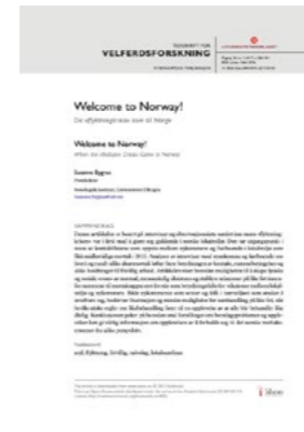
Bygnes, S (2017) Welcome to Norway. Da flyktningkrisa kom til Norge. Publisert i Tidsskrift for Velferdsforskning.

Artikkelen viser at det var stor villighet blant naboer til å bidra til asylsøkernes hverdag etter at de ankom de tre asylmottakene i studien. Hverdagslige møter som det å ta en kopp kaffe sammen og invitere på middag var viktig for å etablere og opprettholde kontakten mellom nykommere og lokalbefolkningen. Muligheten for slike møter ble imidlertid i stor grad påvirket av måten asylmottak ble drevet på og av ulike forståelser av frivillighet. Store og mer rigid drevne asylmottak hindret både nykommeres opplevelse av kontroll over eget liv og begrenset muligheten for hverdagslige møter mellom dem og lokalbefolkningen.