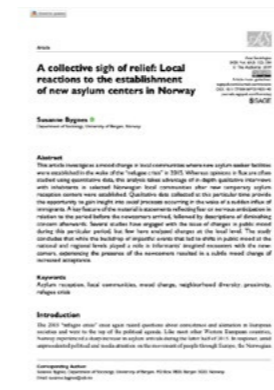
Bygnes, S (2020) A collective sigh of relief: Local reactions to the establishment of new asylum centers in Norway. Publisert i Acta Sociologica.

Ved å ta i bruk norsk paneldata viser funnene at folks syn på asylsøkere endret seg etter flyktningkrisen. Resultatene viser at folks forståelse av asylsøkere kan deles inn i tre kategorier. Disse inkluderer en negativ forståelse av asylsøkere hvor en ser dem som lykkejegere og finansielle byrder på samfunnet, en inkluderende forståelse av asylsøkere hvor en ser på asylsøkere som personer som flykter og trenger vår hjelp, og en mer distansert og objektiv forståelse av asylsøkere hvor en tenker på dem som personer som flykter fra en vanskelig situasjon, men som ikke nødvendigvis trenger vår hjelp. Resultatene viser at folks forståelse av asylsøkere endret seg etter flyktningkrisen og at endringen skjedde mellom de to siste kategoriene—fra involvert til distansert.