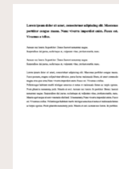
Bygnes, S og Strømsø, M (publisert i 2022) A promise of inclusion: on the social imaginary of organized encounters between locals and refugees. Publisert i Journal of Intercultural Studies .