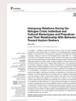
Bye, H, H (2020) Intergroup Relations During the Refugee Crisis: Individual and Cultural Stereotypes and Prejudices and Their Relationship With Behavior Toward Asylum Seekers. Publisert i Frontiers in Psychology .