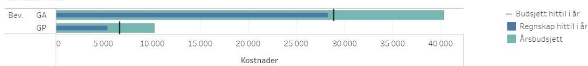
Figur 2 Kostnader grunnbevilgning (GB) Tall i 1000 kroner

Kostnadene viser et lite underforbruk på GB annuum og GB prosjekt (øremerkede midler).