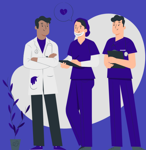
Illustration by Freepik Storyset