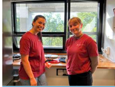
Her stekes det vaffler med smil!