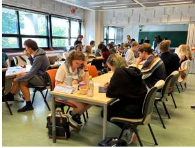
Vaffelorakelen er i gang