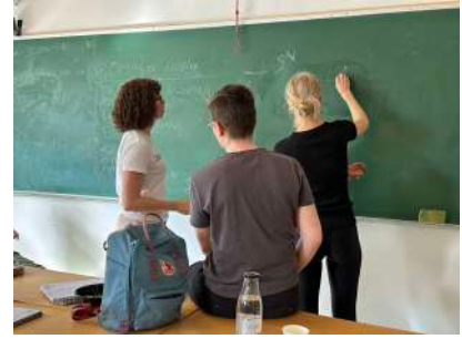
Gode matematiske samtaler ved tavlen