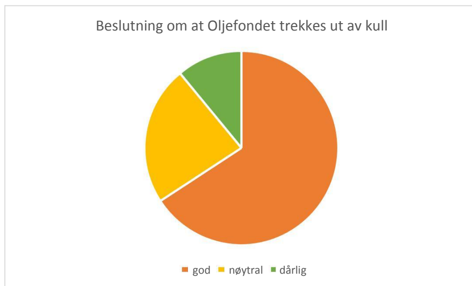
Figur 1. Prosentvis fordeling av holdninger til vedtak om at oljefondet trekkes seg ut av kull. Norsk Medborgerpanel runde 7. Data er vektet.

Som tabell 1 og figur 1 viser, mener nærmere 70% av den norske befolkning at å trekke oljefondet ut av selskaper som driver med kull, var en god beslutning. Omtrent 10% mener det var en dårlig beslutning, og om lag 20% er nøytrale til saken.