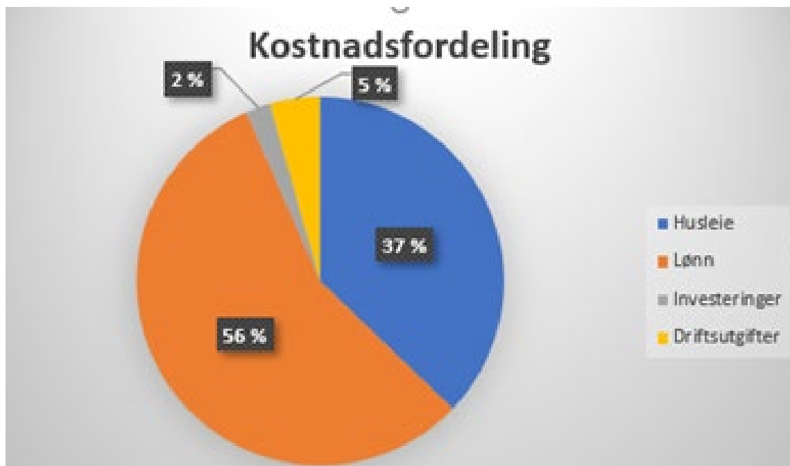
Figur 1. Kostnadsfordeling 2022

Ettersom lønnskostnadene og husleiekostnadene i stor grad er faste er det vanskelig for UM å redusere disse. I tillegg har UM en betydelig infrastruktur knyttet til utstillinger, samlinger, og laboratorier som vil kreve jevnlige reinvesteringer fremover.