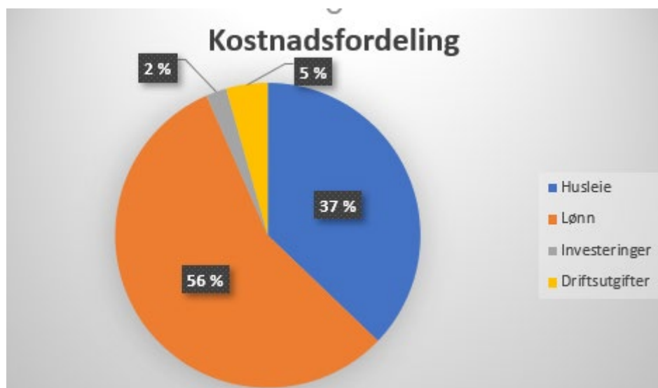
Fig 5 viser hvordan de ulike kostnadene ved UM fordeler seg i 2022