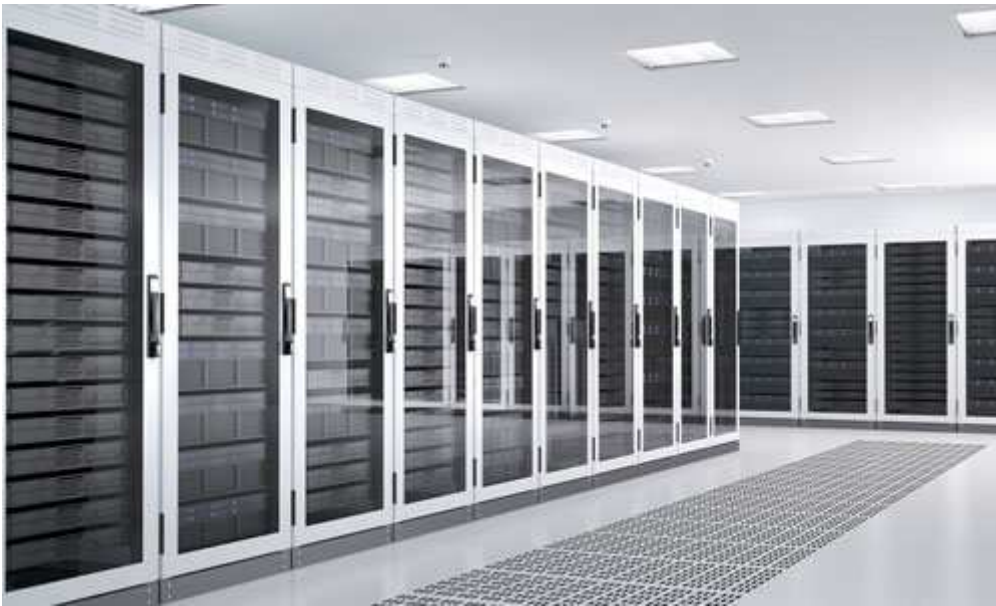
Moderne forskning krever stor regnekapasitet og lagringsplass.