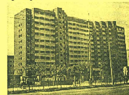
Dette er den nye bygningen til de samfunnsvitenskapelige fagene ved Fudan University. Department of International politics holder til her.

Senteret vil bl.a. kunne tjene som et serviceorgan for norske studenter som vil lære kinesisk språk eller om kinesisk politikk og samfunn. ISP vil trekke Institutt for statsvitenskap, UiO, og andre statsvitenskapelige miljøer i Norden inn i utviklingen av det videre samarbeidet omkring Nordic Centre ved Fudan University. Også andre fagmiljøer ved UiB vil kunne gjøre seg nytte av senteret. Blant Kinas ca. 1000 universiteter hører Fudan University til i gruppen blant de tre beste og viktigste.