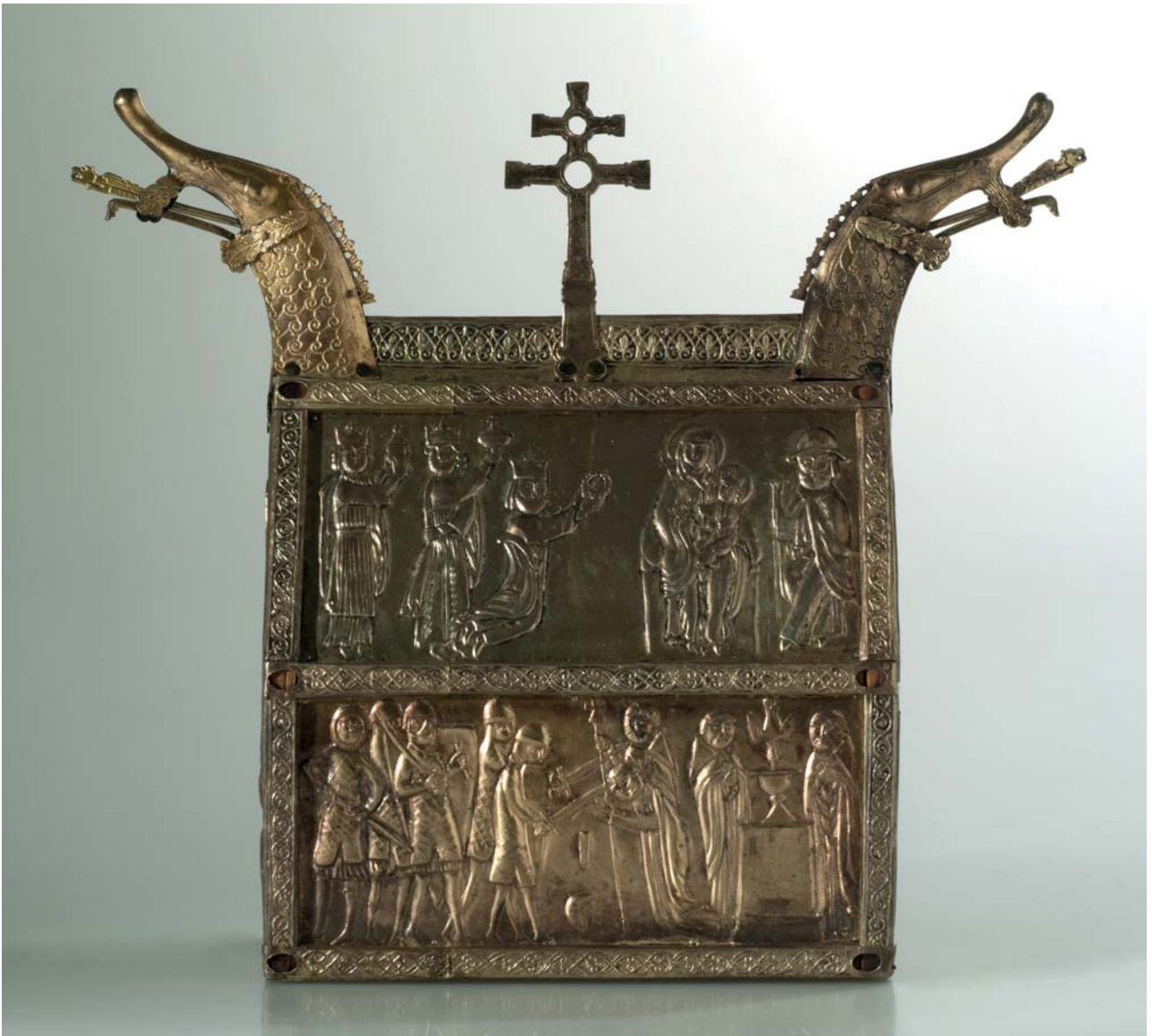
■ Fig. 3: Relikvieskrin formet som en "stavkirke", fra Hedalen kirke i Valdres. Skrinet er laget av tre og kledd med dekorerte messingplater. Drapet på erkebiskop Thomas er fremstilt på langsida i nedre del av skrinet, altså "langveggen" på kirkebygningen. Skrinet vist på fotoet er en kopi som tilhører Universitetsmuseet i Bergen.