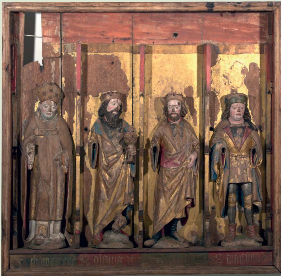
■ Fig. 4: St. Thomas Becket fra alterskapet i Lurøy kirke, Nordland. Alterskapet, som er datert til 1450-1490, har fire helgenfigurer. To kan knyttes til England og to til Norge. Regnet fra venstre står først St. Thomas, deretter den norske helgenkongen St. Olav, så St. Magnus orknøyjarl og lengst til høyre den engelske helgenkongen St. Edmund. Alterskapet kom i 1835 inn til daværende Bergens Museum og står nå i Kirkeutstillingen ved Universitetsmuseet i Bergen.

Den første hendelsen står i Håkon Håkonssons saga, der det blir fortalt at kong Håkons skip (i 1225) møtte skipet til John Stål utenfor Jæren, og at han da hadde faret til den hellige Tomas erkebiskops voka