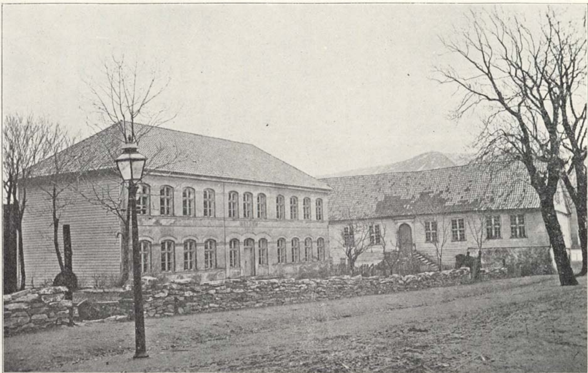
■ Fig 8. Bergens museum hadde frå 1831 tilhald i huset til høgre, «det klagenbergske hus». I 1841 sto også nybygget klart (til v.) – den første bygningen i Noreg reist særskilt for museumsformål.