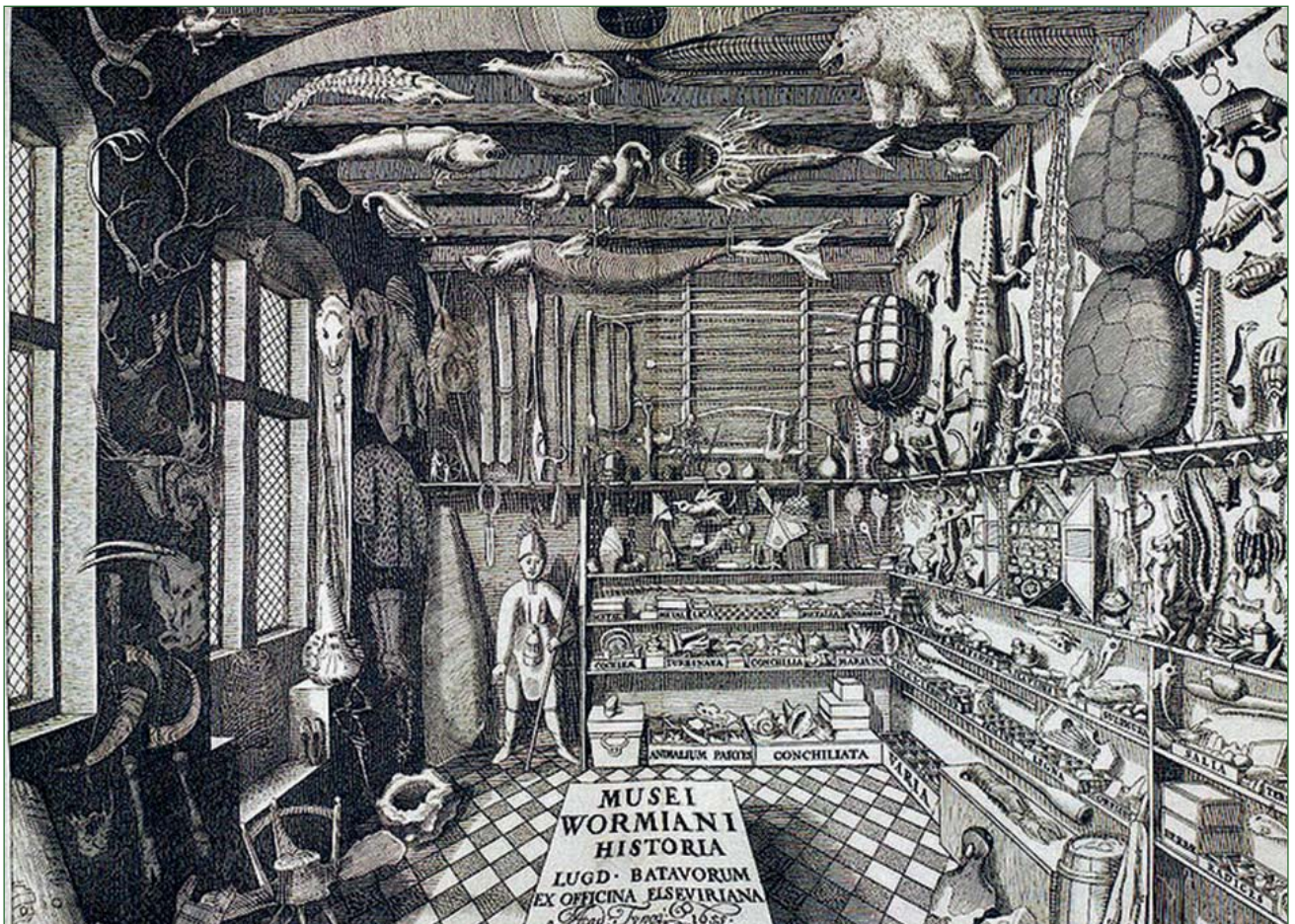
■ Fig 2. Ole Worm sitt kuriositetskabinett i København, frå «Museum Wormianum» (1655). I kuriositetskabinettet samla og viste ein fram sjeldne og merkelege gjenstandar som utfodra tanken, men som samtidig blei plassert inn i ein ordna heilskap i det dei fekk plass i kabinettet.

og kuriøse på 15- og 1600-talet var forankra i gjengse førestellingar om verda og korleis ho var organisert og slik var i takt med tidas kunnskap, blei dette samlarprinsippet på 1700-talet altså degradert til noko ein oppfatta som uvitskapleg og irrelevant: Naturforskarer som Friedrich Martini (1729-1778) i Berlin skilde såleis mellom naturforskarer , som var ute etter dei vesentlege eigenskapane, systemet og nytten, og liebhabaren som var opptatt av det ytre, etter avvekslande former og ytre venleik. 8