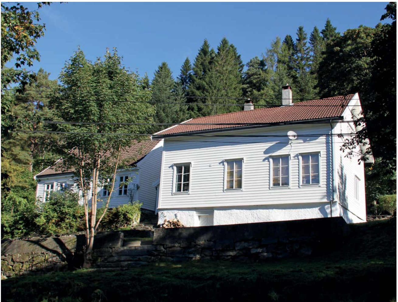
■ Figur 14. Åstveit i dag. Huset til høgre gjekk også lenge etter Jan Greves død under namnet «museet», og etter tradisjonen var samlinga oppstilt i to egne rom..

Kor typisk eller utypisk Greve-samlinga var for samlarkulturen i Bergen og Noreg på 1700- og byrjinga av 1800-talet er vanskeleg å slå fast all den tid det førebels er forska lite på denne. Truleg fanst det eit heilt spekter av samlingar frå små samlingar av eksotiske, vakre og kostbare gjenstandar som kanskje først og fremst hadde eit dekorativt føremål, til samlingar som den på Åstveit som var innvoven i samtidas vitskaplege praksisar og utvekslingar. Slike naturforskar-samlingar kunne på si side vera alt frå enkle herbarium til den meir omfattande