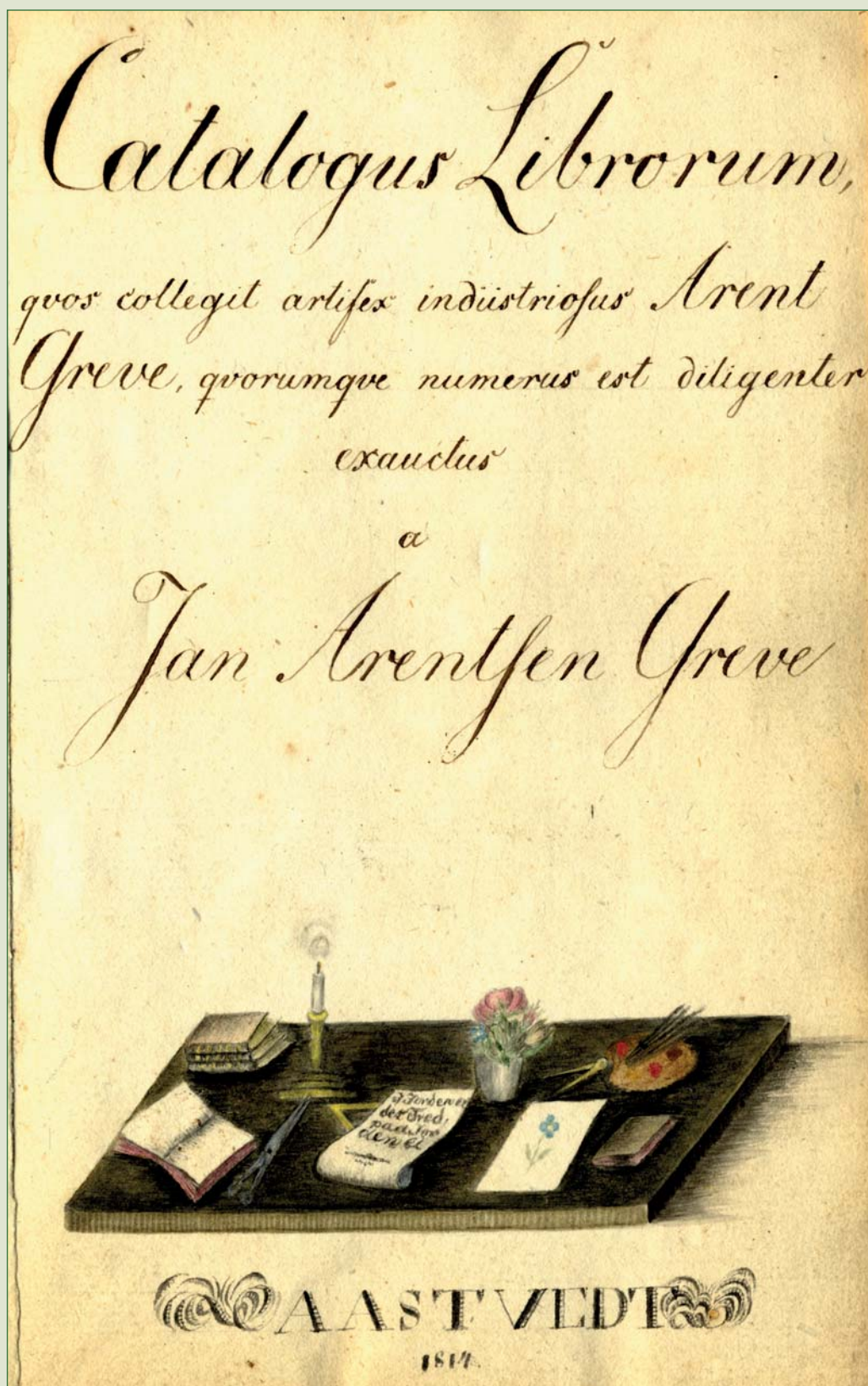
■ Figur 13. Katalog over biblioteket til familien Greve frå 1814 (UBB: Manuskript- og librarsamlinga, Ms. Ms 1038).