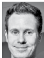
AUF-LEDER ESKIL PEDERSEN GÅR MOT REGJERINGENS FORMYNDERI, VG