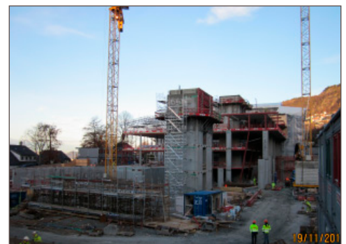
Byggeplassen ultimo november. Råbygget er her godt og vel halvveis.

Vi vil arrangere åpent hus både i 2011 og 2012.