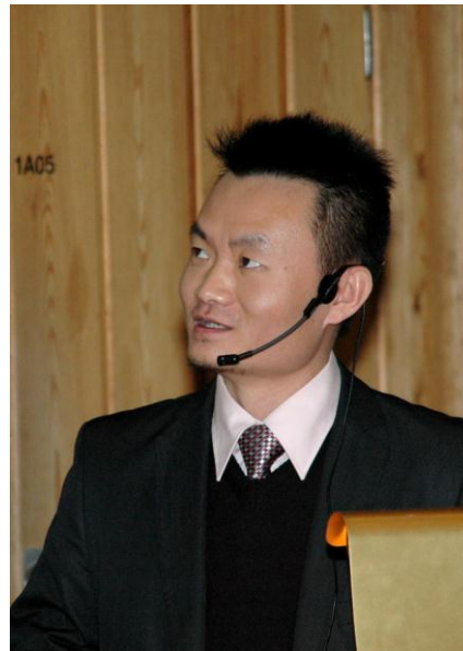
Doktoranden.