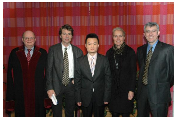
Doktoranden sammen med Custos og komiteen.