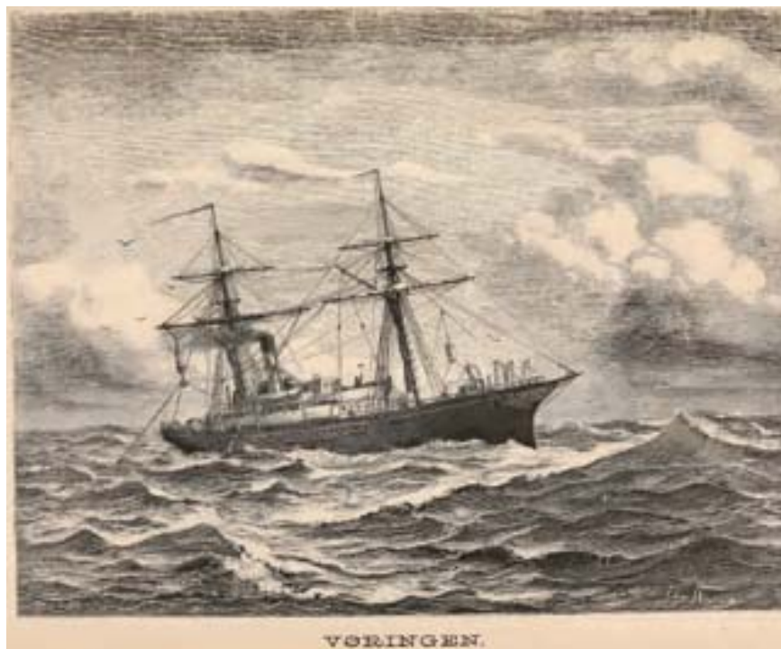
■ Fig. 2 SIS «Vøringen» som ble brukt under «Den Norske Nordhavs-Expedition»

karaktertrekk som kunne tyde på slektskap med andre dyregrupper.