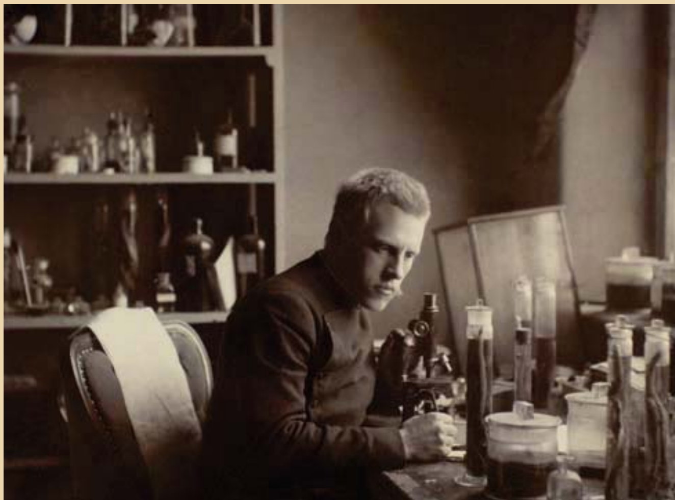
■ Fridtjof Nansen ved sitt arbeidsbord på Bergens Museum i 1887. Foran seg har han sitt kostbare mikroskop og formalinglass med slimål. 26 år gammel tok han doktorgraden på en skjellsettende avhandling om slimålens nervesystem.

skiveformete og markliknende dyr som lever på pigghuder, særlig sjølliljer og fjærstjerner. Nansen beskrev seks forskjellige arter hvorav to var nye. Dette arbeidet ble belønnet med Frieles Gullmedalje og viste en helt karakteristisk side hos Nansen; han vek ikke unna for vanskelige oppgaver. Han hadde helt på egen hånd lært seg den mikroskopiske teknikken og utnyttet den på en meget selvstendig måte. Dette første arbeidet fikk en bred plass i den store tyske «Handbuch der Zoologie» som hovedgrunnlag for kjennskapen til den egenartede og avvikende ormegrup-