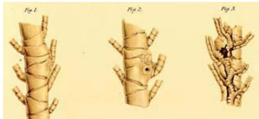
■ Fig. 6 Utsnitt av armer på ei fjærstjerne med antydning til deformitet som følge av en fastsittende Myxostoma . Noen ganger forårsaker myxozoidene galler og cyster hos verten. Slike cyster er også funnet på fossile sjølliljer som er daterte til å være ca 190 millioner år gamle (Hess, 2010). Figuren er hentet fra von Graff (1887).

giganteum . Nansen sin oppmerksomhet begrenset seg ikke bare til nervesystemet. Hans beskrivelser omfattet også sanseorganer, kjertelorganer, muskulatur, tarmkanal, og kjønnsorganer. Sammenligningen med andre dyregrupper var sentral for å forstå myxozoidenes slektskapsforhold i det store stamtreet for dyreriket. Med grunnlag i sine