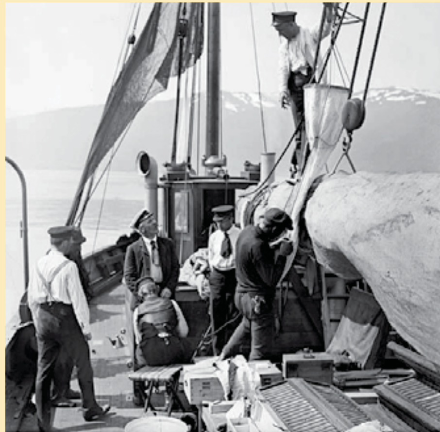
■ Fridtjof Nansen med kollegaer i Sognefjorden med FF Armauer Hansen i 1913.

N ansen studerte mikroanatomien i sentralnervesystemet hos små sjødyr. Som den fremragende fagmannen han var, fremstilte han preparatene for mikroskop ved å kutte bestanddelene opp med en god mikrotom, instrumentet som skjærer tynne snitt av preparater til mikroskopering. Nansen farget dem med «sølvfarge», en teknikk Camillo Golgi fra Pavia hadde utviklet i 1873, og studerte snittene under det nye Zeiss-mikroskopet som hans far hadde gitt ham.