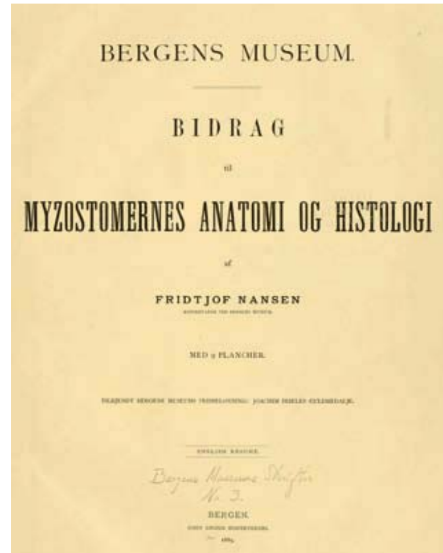
■ Fig. 7 Forsiden av Nansens første zoologiske avhandling.

For sitt arbeid med myxozoidene ble også Nansen hedret med «Jochim Frieles Guldmedaille». Anerkjennelsen kom fra et hjemlig vitenskapelig miljø som allerede var vel ansett i Europa og Amerika for sine zoologiske studier. Men de levde muligens etter Aristoteles sitt førkristne motto: « - vi bør studere alle slags dyr uten ubehag, for alle og ethvert vil vise oss noe naturlig og noe vakkert.» For de fleste av «de mærkelige eller nye i havet ved den bergenske kyst levende dyr», for å