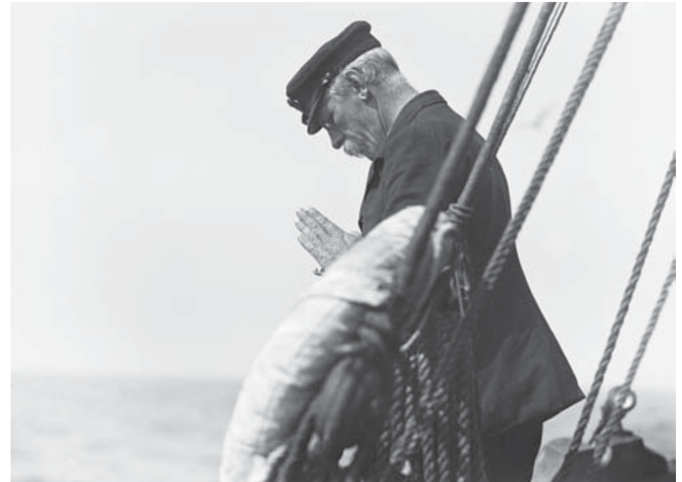
■ Fridtjof Nansen operating the sextant on RV Armauer Hansen, research cruise in 1913.

These appeals fell on deaf ears because in the articles and books written in 2006 to coincide with the centenary of the Nobel Prize