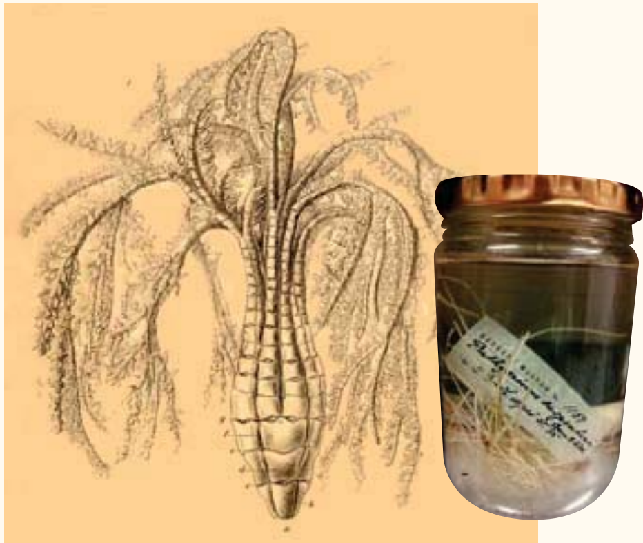
■ Fig. 5 Tegningen er fra originalbeskrivelsen av en ny art, Bathycrinus carpenteri . Fotografiet viser dagens tilstand til den samme prøven.

per. Han konstaterte at «Ved denne fremgangsmaade lykkedes det mig ialfald delvis at kunde forfølge nerverne til sine yderste forgreninger, ligesom nervesystemets struktur blev meget skarpt fremhevet.» Det er resultatet av slik anvendt metodikk vi ser i figur 8 på Plansje I, der Nansen har avbildet indre organer hos sin nyoppdagede art, Myxostoma