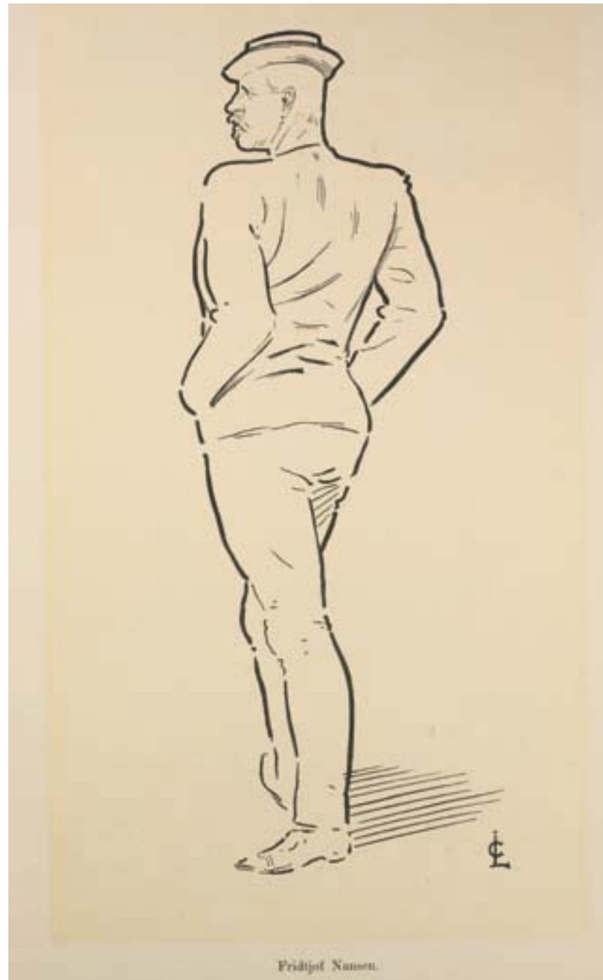
■ Illustrasjon: Billedsamlingen, Universitetsbiblioteket i Bergen

Willassen, E. 2011. Nansens Makkverk, Bergens Museums Årbok.