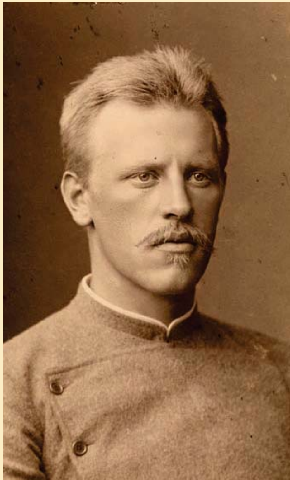
■ Fridtjof Nansen.