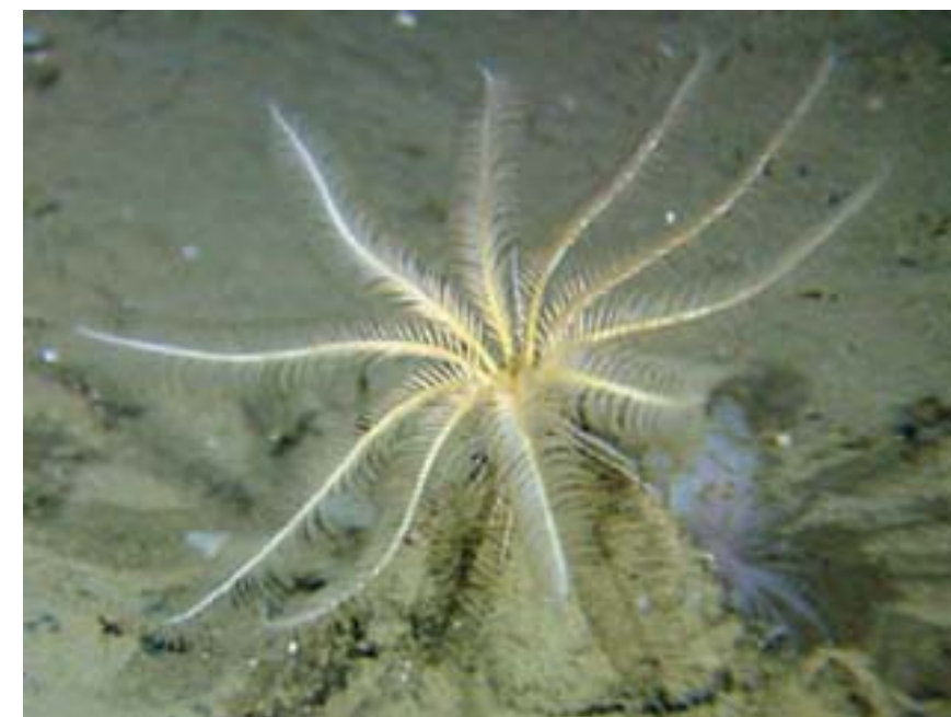
■ Fig. 4 Ei fjærstjerne fotografert på 1000 meters dyp. Det er på slike dyr en kan finne myzostomider, - de små «makkene» som Nansen studerte i sitt første zoologiske arbeid.