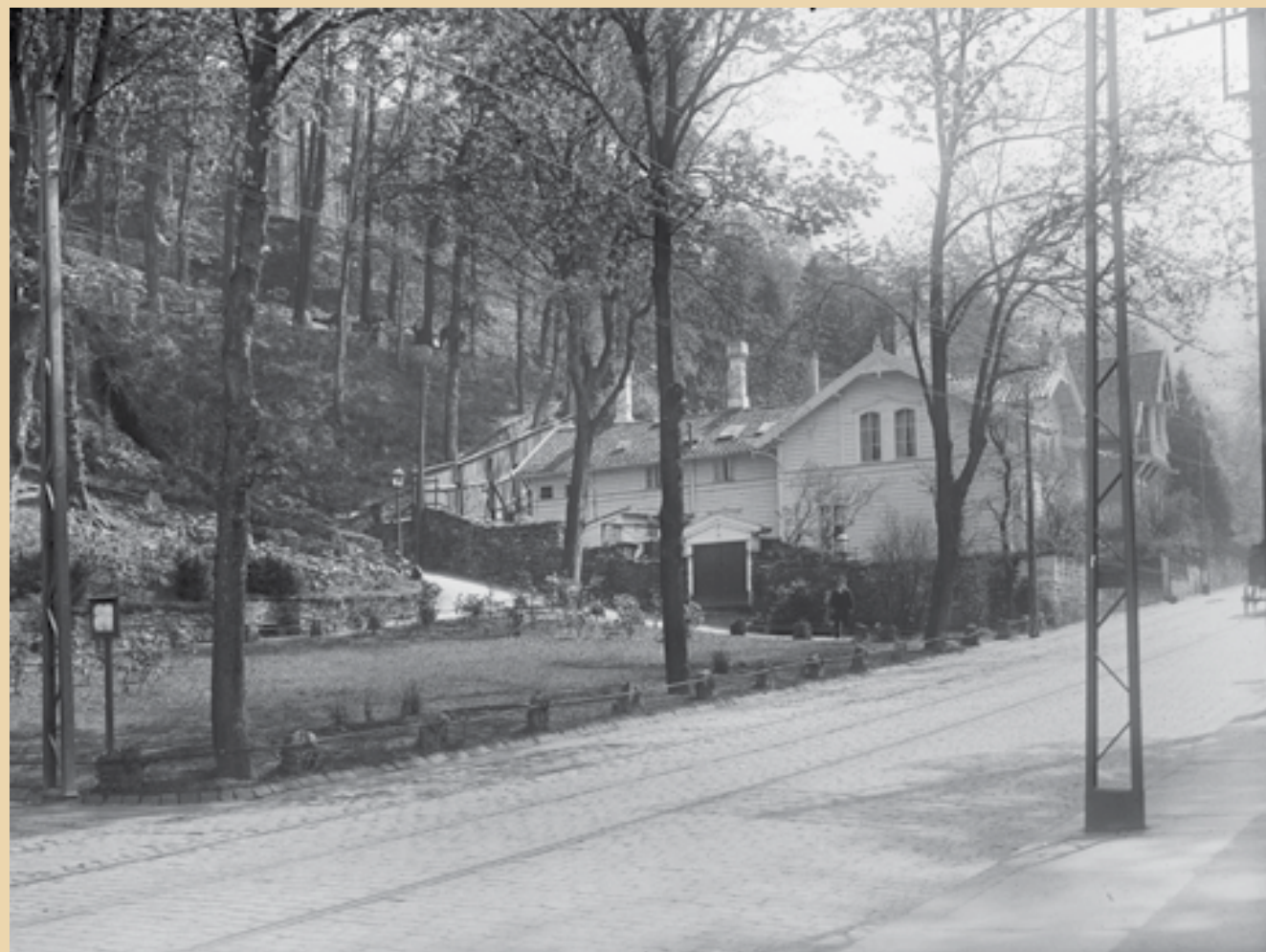
■ Kalfarveien 32, pastor Holdts bolig i 1875-91.