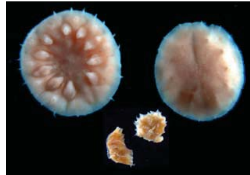
■ Fig. 9 Fire individer av Nansens materiale av myzostomider slik det fortøner seg i dag. Øverst Myzostoma giganteum sett fra henholdsvis underside og ryggside. Nederst Myzostoma graffi sett fra siden og fra ryggside.

* En video om «Nansens makkverk» ble sendt på NRK2 28. mai 2011 5