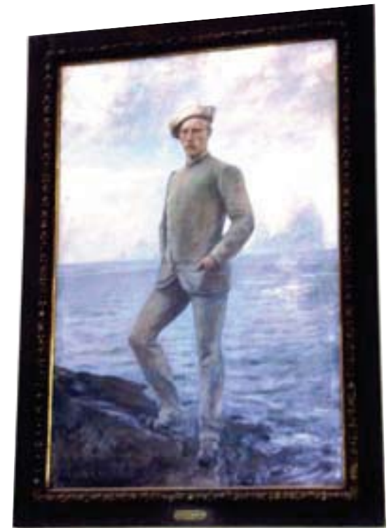
■ Portrait of Fridtjof Nansen at the Fram Museum, Oslo.

It is difficult to believe that Gustaf Retzius, (1842-1919) who had edited Aftonbladet from 1884 to 1887, was not influenced by Nansen's political activities. Retzius was another multi-talented man who as an anatomist became famous for his studies on the micro-anatomy of the inner ear. He was appointed Professor of Histology at the Karolinska Institutet