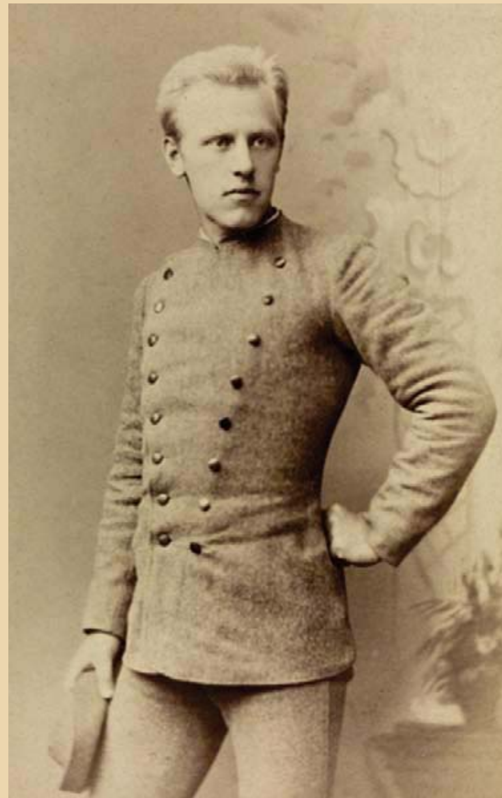
■ Fridtjof Nansen, Bergen 1885