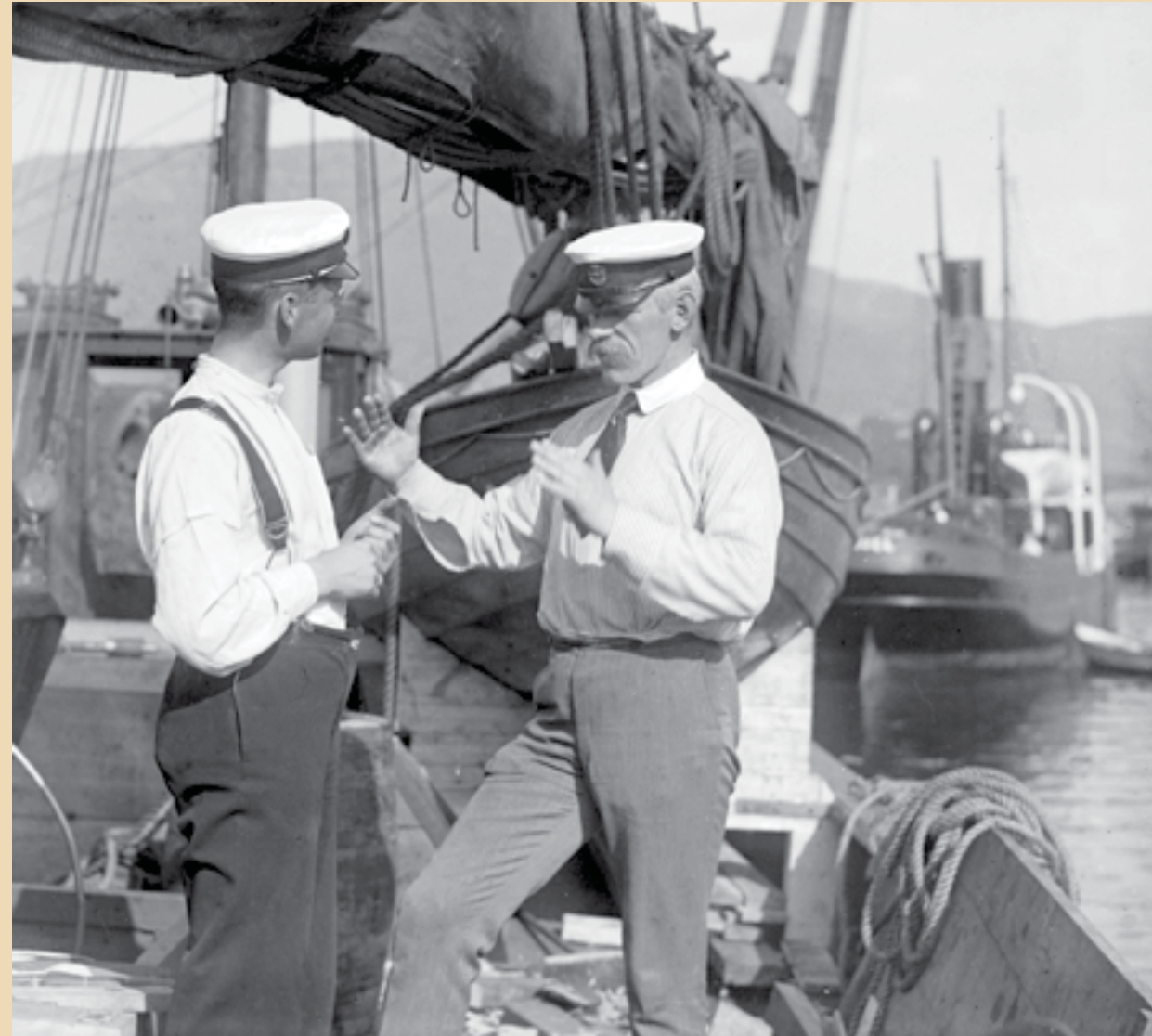
■ Fridtjof Nansen on RV Armauer Hansen in 1913.