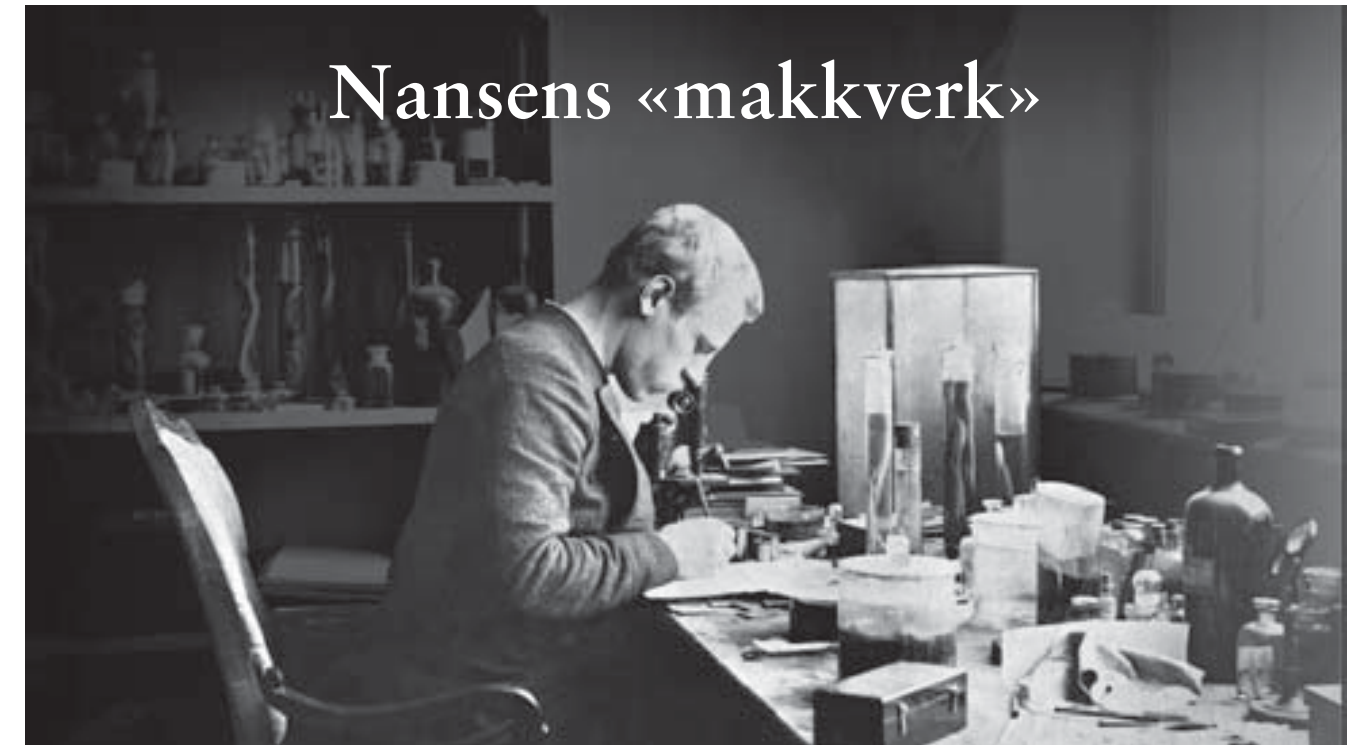
■ Fig. 1. Fridtjof Nansen i zoologiske studier ved Bergens Museum.